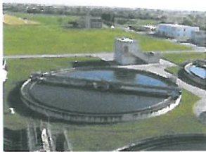
Impianti di depurazione