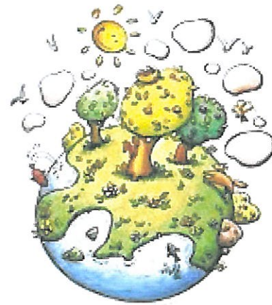
Squadra "Sostenibilità ambientale"