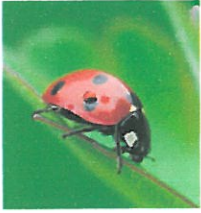
Lotta biologica – coccinella