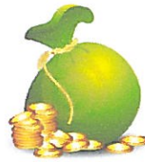
Equa distribuzione di denaro