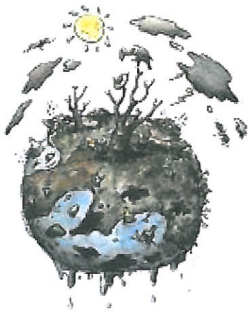
Squadra "Dissesto ambientale"