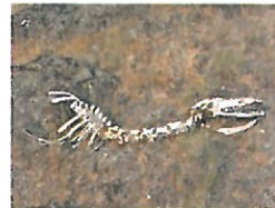
Estinzione fauna e flora