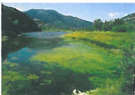
Eutrofizzazione delle acque