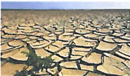
Erosione del terreno